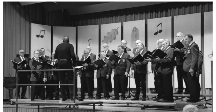
Die Langenenslinger Sänger in Aktion

Zum Abschluss versammelten sich die Sänger beider Chöre nochmals auf der Bühne und verabschiedeten sich eindrucksvoll mit dem Weinlied „Aus der Traube in die Tonne“ von ihrem dankbaren Publikum.