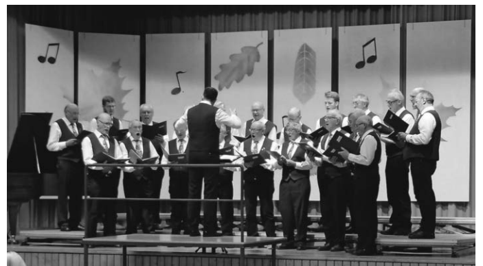
Unsere Gäste vom Liederkranz Altheim