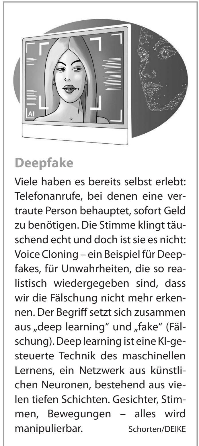
Illustration: © droigks/DEIKE