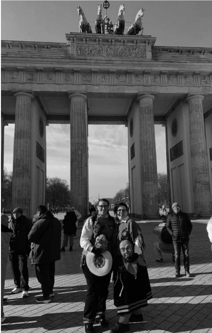
Vertreter des Narrenvereins Langenenslingen vor dem Brandenburger Tor