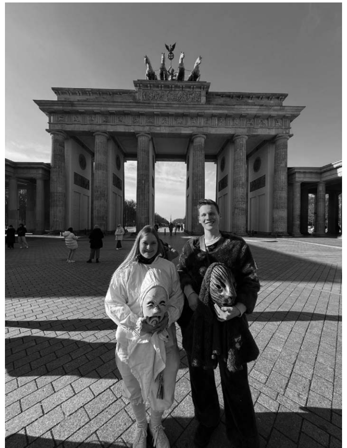
Vertreter der Biberzunft Andelfingen vor dem Brandenburger Tor

Die Biberzunft Andelfingen und der Narrenverein Langenenslingen sind dankbar, Teil dieses Verbands zu sein und bei diesem besonderen Besuch in Berlin, dabei gewesen zu sein.