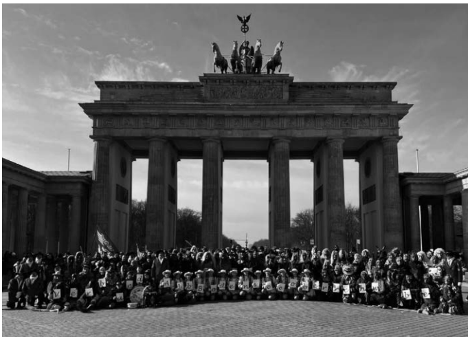
Gruppenfoto aller Teilnehmer der VAN Berlin-Reise