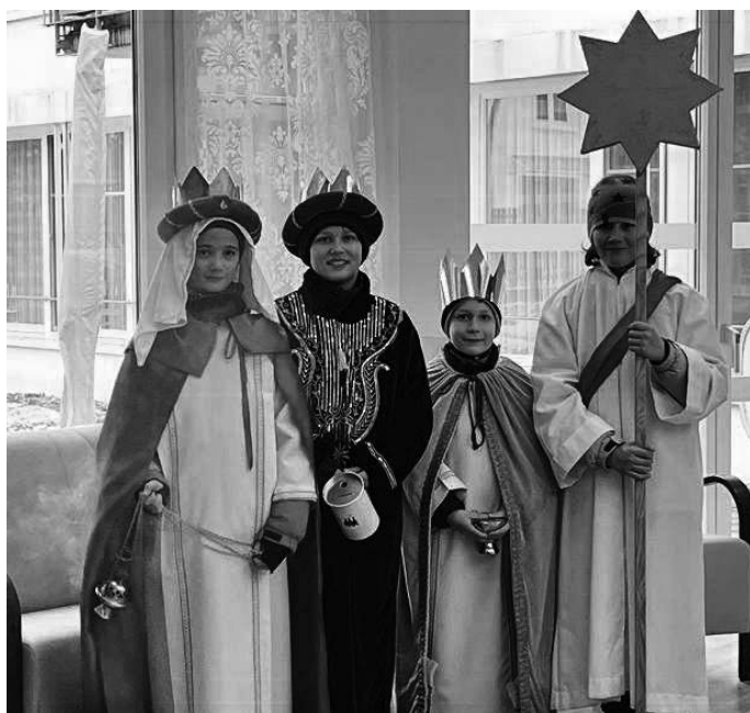
Die Sternsinger brachten ihre Botschaft

„Wir – die Bewohner und das Mitarbeiterteam, freuen uns sehr auf Ihren Besuch und Ihre Teilnahme am Wochenprogramm“ Das Haus für Senioren wünscht allen von Herzen eine gute Woche Die Bewohner mit Mitarbeiter wünschen allen ein gesundes neues Jahr