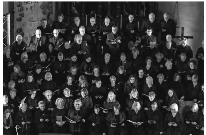
Blick auf die Chorsänger

Weitere wöchentliche Chorproben sind auch immer dienstags um 20:00 Uhr. Es darf gern auch erst mal „geschnuppert“ werden. Bei Fragen wenden Sie sich gerne an Elisabeth Schmid unter 07376-412