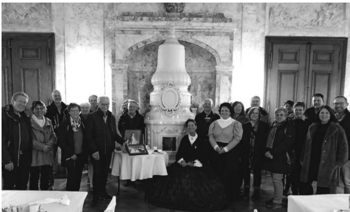
Zum Abschluss der Saison trafen sich die Tennisfreundinnen und -freunde zu einer unterhaltsamen Führung im Schloss Aulendorf.