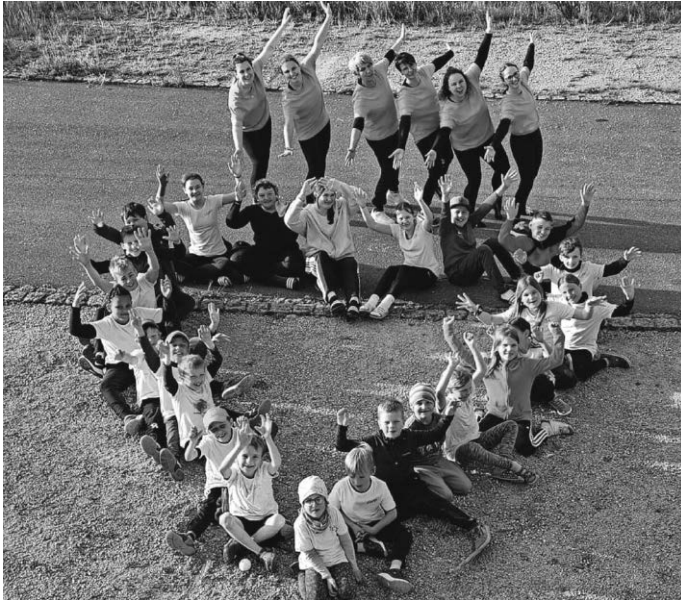
Tennis mit Herz - das Jugendcamp ist immer ein highlight!