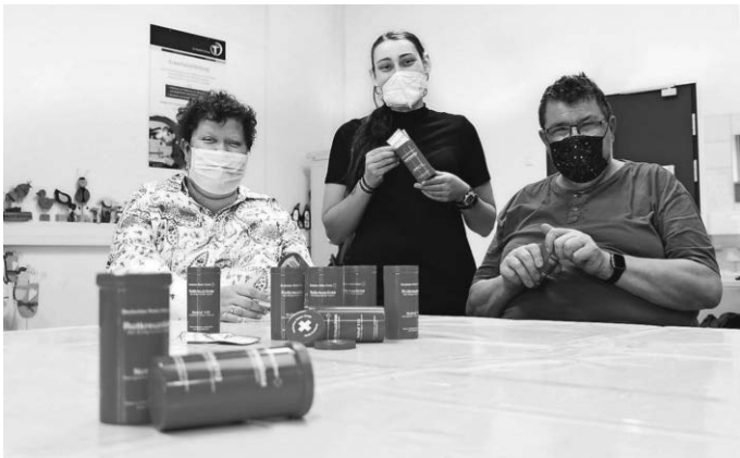
In der Werkstatt für behinderte Menschen werden die Rotkreuzdosen mit Datenblättern und Hinweisaufklebern bestückt.

Info: Weitere Infos gibt es unter www.rotkreuzdose.de . Dort sind auch alle Ausgabestellen aufgelistet.