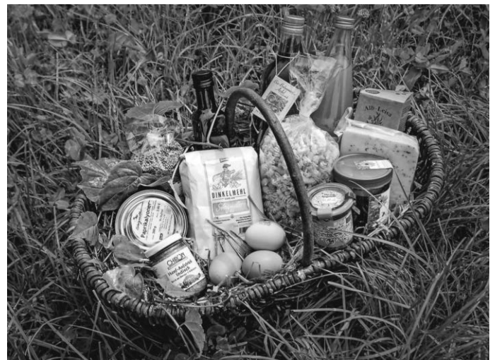
Ein Korb voller regionaler Bio-Köstlichkeiten

Die 14 Bio-Musterregionen in Baden-Württemberg sind ein Instrument des Landes um Ideen, Projekte und Lösungen zu entwickeln, die den ökologischen Landbau sowie das Bewusstsein dafür fördern und ein stabiles Netzwerk der Akteure des Bio-Sektors aufbauen.