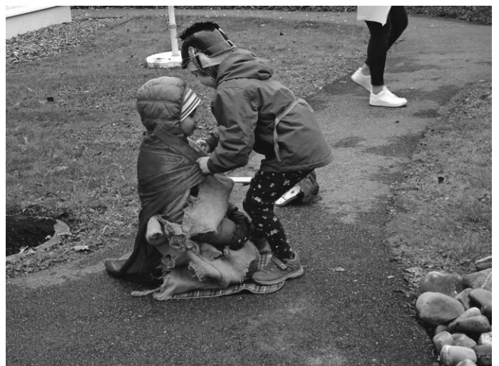
Hl. Martin zieht dem Bettler den halbierten Mantel an

Über den Applaus der Omas und Opas und die süßen Herzchen aus Teig (zum Teilen mit den anderen Kindern im Kindergarten) haben sich alle sehr gefreut. Diese hat der Förderverein zur Verfügung gestellt. Herzlichen Dank dafür.