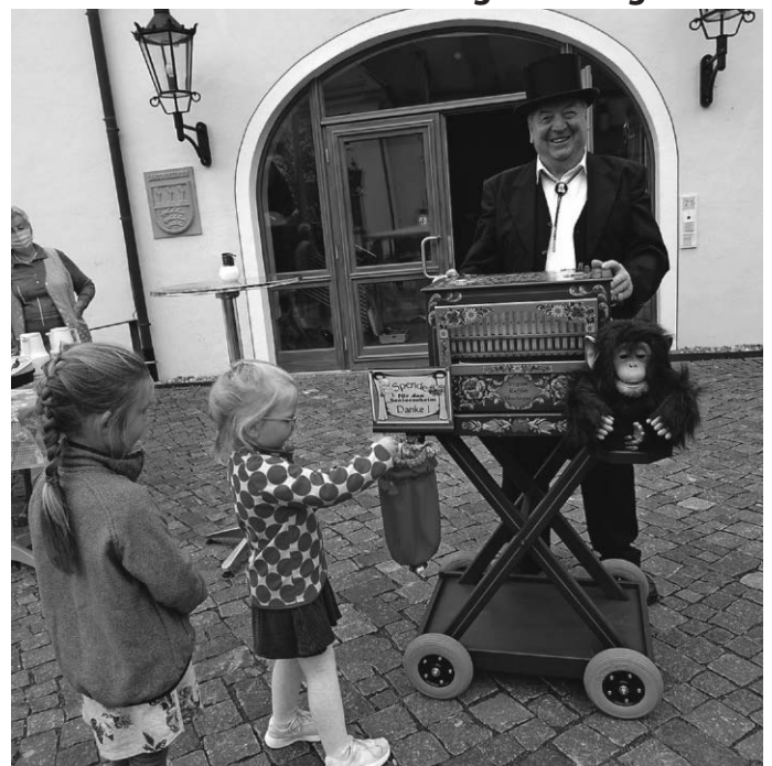
Ein Drehorgelspieler belebt immer einen Markt