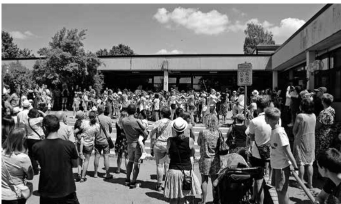
Gespannt verfolgen die Besucher die Darbietungen der Kinder.