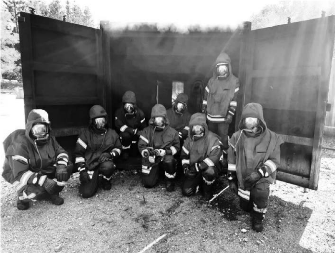
FFW Abtl. Ittenhausen