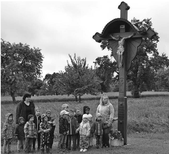
Kindergarten beim Vortrag am Flurkreuz