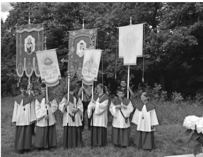
MinistrantInnen und FahnenträgerInnen auf dem Eichberg