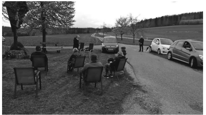
Maiandacht trotz schlechtem Wetter

19.00 Uhr Maiandacht in Ittenhausen an der Grotte nach Ensmad