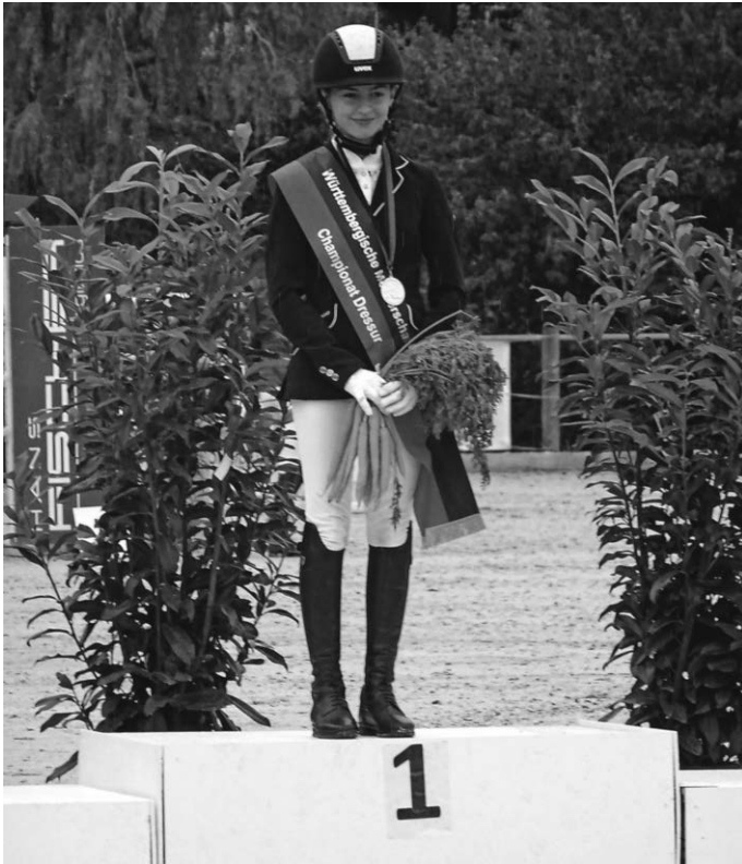
Württomb. Meisterschaften Weilheim 2020

schaften und beim Landesjugendcup wurde sie zusätzlich für den Hilde-Frey-Sportpreis 2020 nominiert. (Sonderpreis für außergewöhnliche sportliche Erfolge und Leistungen bei offiziellen württembergischen, süddeutschen, deutschen oder internationalen Meisterschaften.)