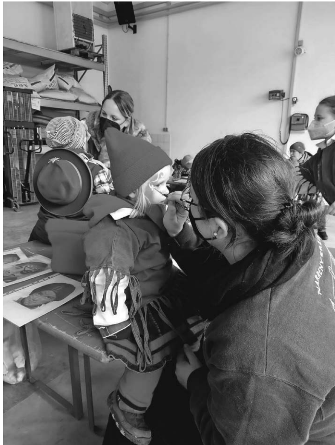
Kinderschminken Kinderballstationen 2022

Am Fasnetsfreitag fanden dann von 14 bis 17 Uhr die Kinderballstationen im Ort statt. An verschiedenen Stationen, wie zum Beispiel dem Kinderschminken, Dosenwerfen oder einem Hindernisparcour auf dem Spielplatz, konnten sich die Kinder austoben und mit Spiel & Spaß die Fasnet feiern. Der anschließende Kuchenverkauf auf dem Rathausplatz kam ebenfalls sehr gut an und der Nachmittag war ein voller Erfolg. Der Narrenverein Langenenslingen bedankt sich bei der Feuerwehr Langenenslingen und dem Turnverein Langenenslingen für die Bereitstellung der Räumlichkeiten und verschiedener Utensilien!