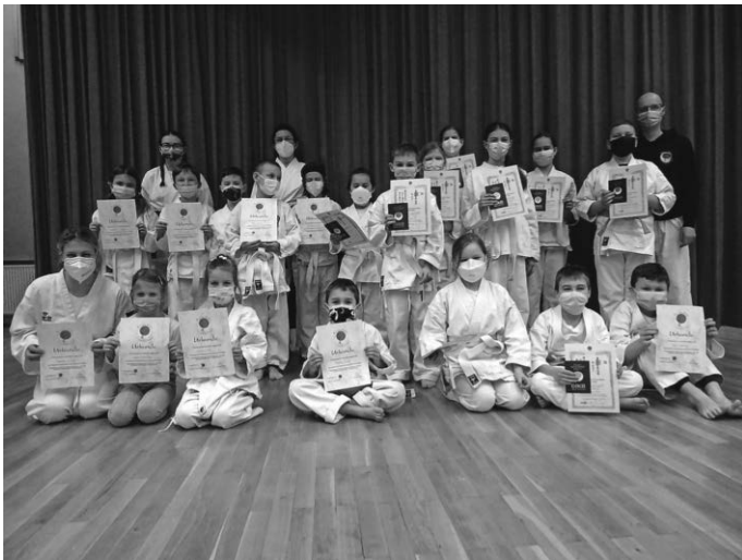
Prüflinge mit Prüfer und Trainerinnen nach bestandener Prüfung

Herzlichen Glückwunsch an alle Prüflinge!