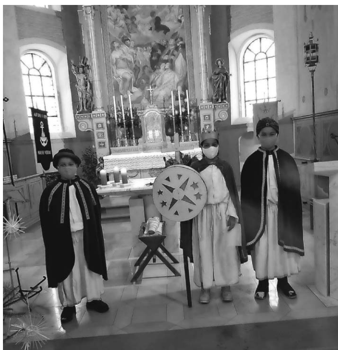
Die Sternsinger im Gottesdienst am 06. Januar

18.00 Uhr Heilige Messe Wir beten für die Lebenden und Verstorbenen von St. Alexiusgut und St. Andreasgut I und II in Ittenhausen.