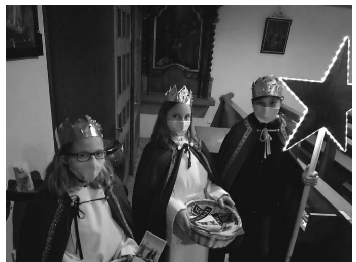
Die Sternsinger am 06. Januar in Friedingen