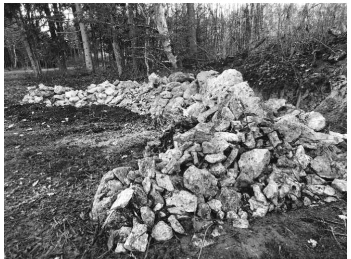
Ein neues Quartier für Zauneidechsen und Co ist entstanden

Weitere Informationen zum LEV unter www.lev-biberach.de