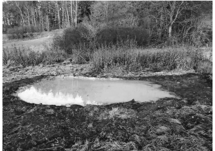
Neu angelegter Kleintümpel soll Amphibien fördern

teil bei, um die eigenen Biotope zu erhalten, was laut LEV auch andernorts Schule machen sollte. Der LEV hat die Maßnahmen rundum betreut, von der Planung, Antragsberatung zum Erhalt der Fördermittel, bei der Betreuung und Mithilfe bei den Arbeiten vor Ort und bei der Endabrechnung.